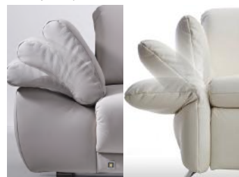
AT1 AT2 2 Armteile zur Auswahl Armteil klappbar (optional, Mehrpreis)