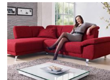
2 Sitzhöhen - preisgleich