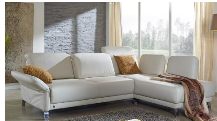
Dieses Modell bekommen Sie in verschiedenen Größen und Farbvarianten

Zeitlos in der Optik - viel Raffinesse im Detail!