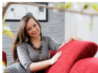
Kopfteilverstellung (optional, Mehrpreis)