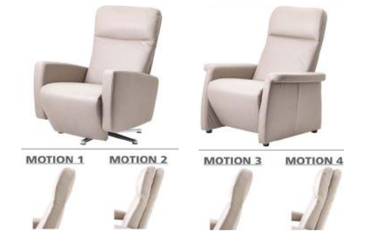
Beispiel Motion 1 und Motion 2 Beispiel Motion 3 und Motion 4