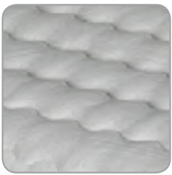
Doppeltuch bis 60°C waschbar